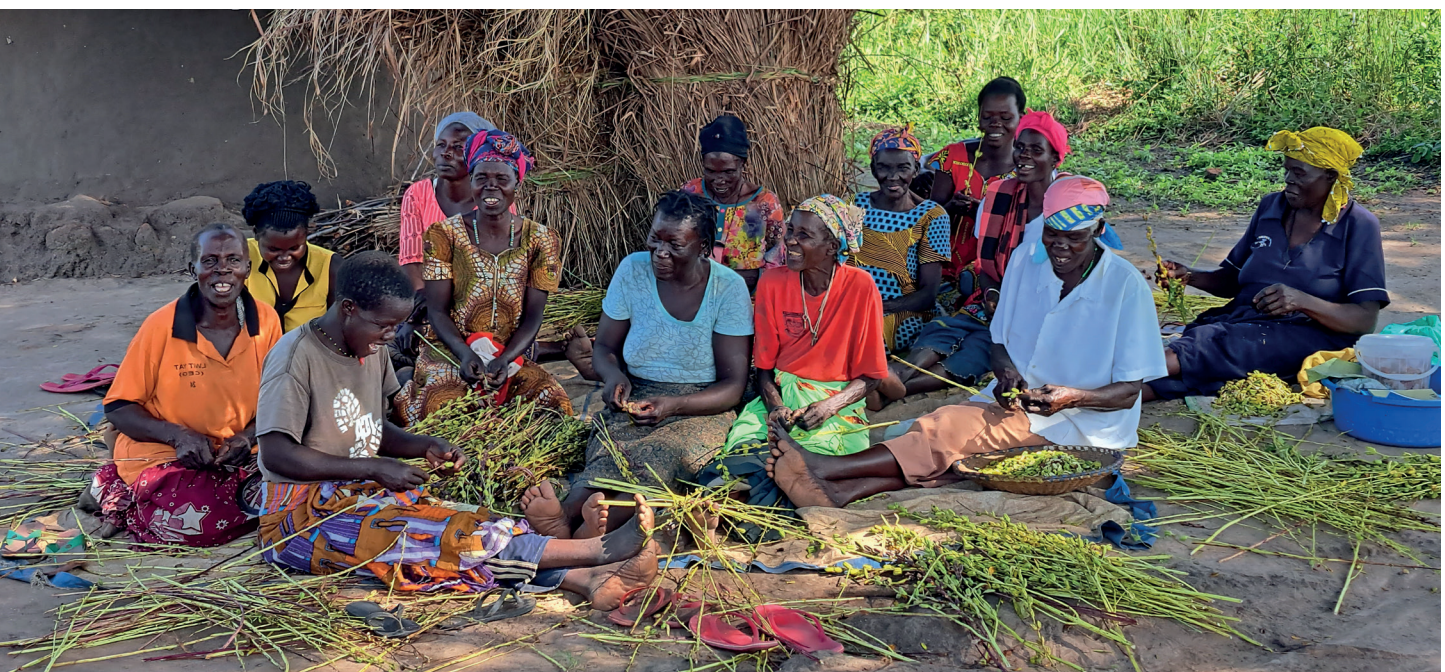
Figure 3: Group of sesame farmers in Uganda