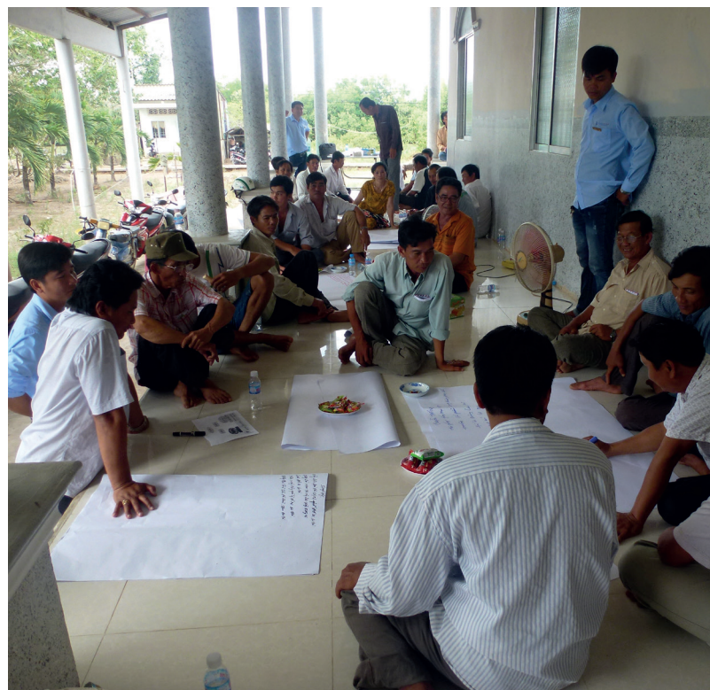
Figure 5: Shrimp farmers' meeting in Vietnam

Indépendamment du type d'organisation et de sa structure, un petit groupe de personnes appelé comité de la prime Naturland Fair doit être mis en place. Ce groupe doit représenter les intérêts de tous les membres de l'organisation. Il est responsable de la prise de décision démocratique concernant l'utilisation de la prime de développement et son administration.